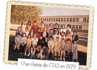
Une classe de CM2 en 1979