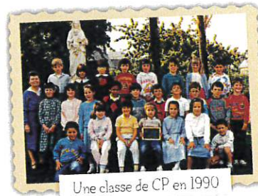
Une classe de CP en 1990