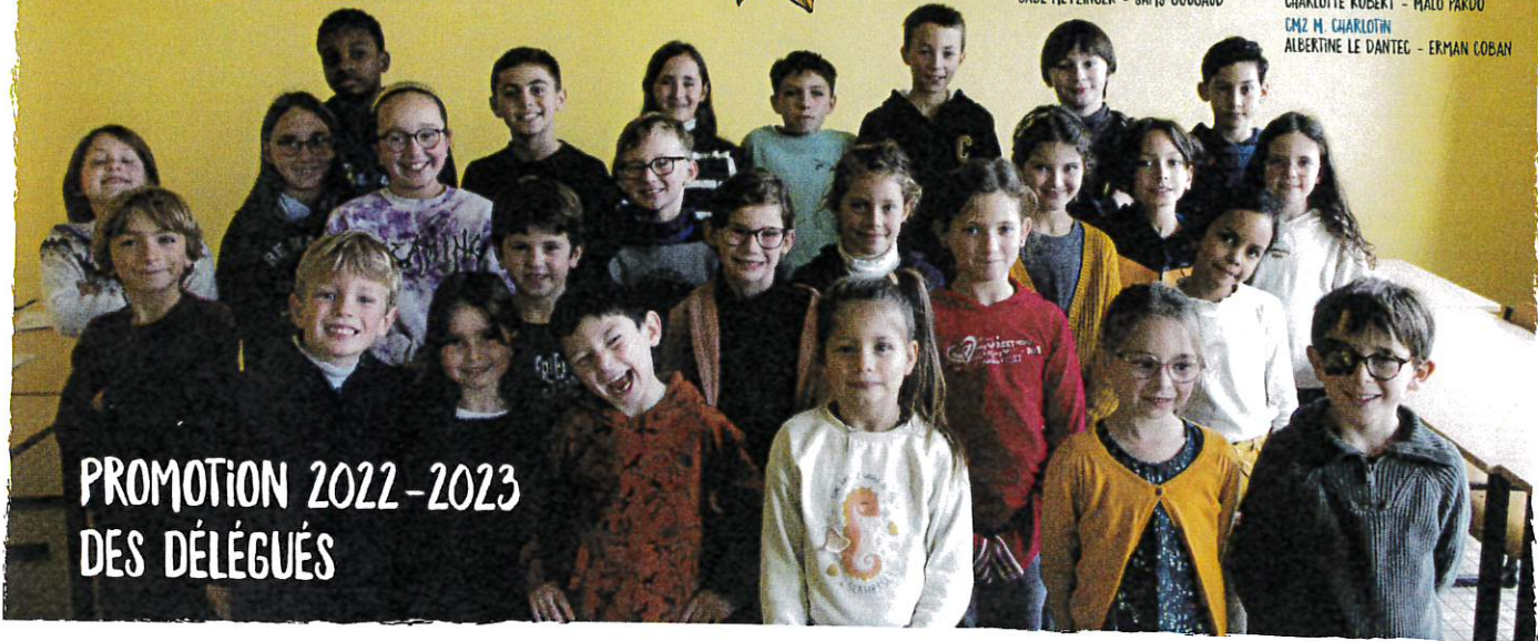
PROMOTION 2022-2023 DES DÉLÉGUÉS